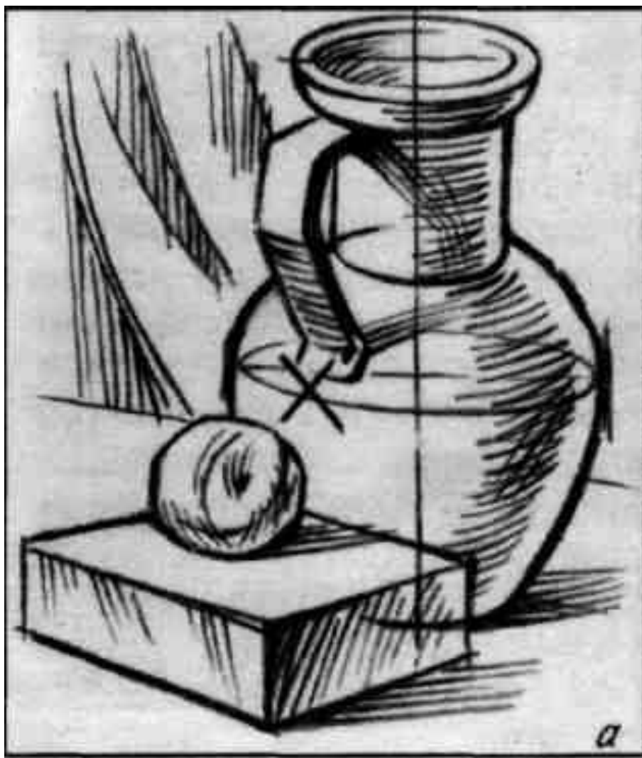
Изображение слишком велико к формату