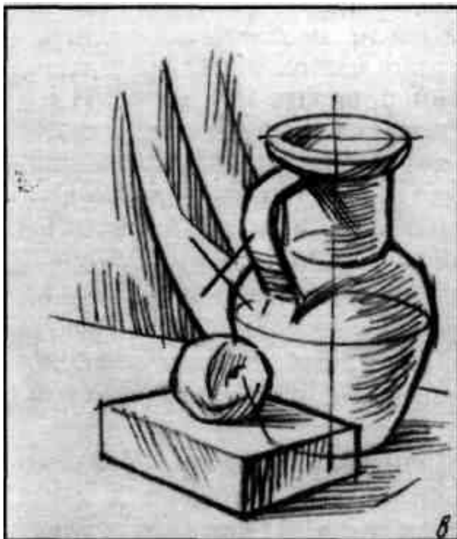
Изображение сдвинуто вниз