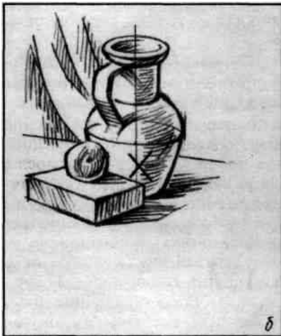
Изображение очень мало к формату и сильно сдвинуто вверх-влево